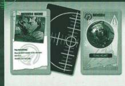
Aktions- und Flugzeugkarten

Es gibt zwei Arten von Auftragskarten, die du dir holen kannst: Flugzeugkarten und Aktionskarten.