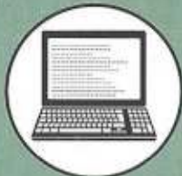
Zugang zur Datenbank

Hinweis: Du darfst dir immer nur eine Karte ansehen. Wenn du auf dem Archivkartenstapel eine "versteckte Bombe" findest, bist du in eine Falle geraten!