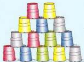
Der Spieler mußte einen grünen Eimer entfernen - den oberen natürlich.