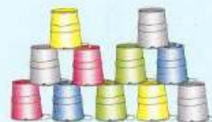
Ein blauer Eimer wurde entfernt werden und darüber alle von ihm gestützten.

Sobald der Spieler die betroffenen Eimer entfernt hat, werden alle ausgespielten Karten offen auf einen Ablagestapel gelegt.