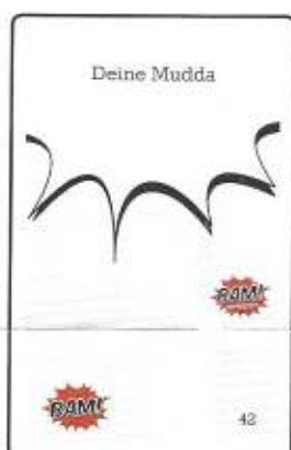
169 graue Begriffskarten