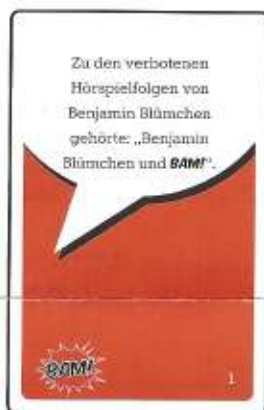
39 rote BAM! -Karten