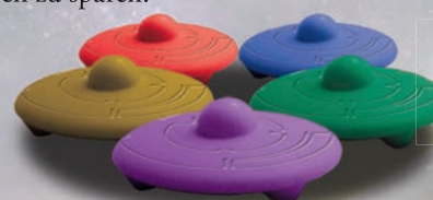
Schiffe der Spieler

Jeder Spieler erhält 20 Plastikschiffe in seiner Spielerfarbe. Die Schiffe sind so gebaut, dass sie gestapelt werden können, um Platz auf dem Spieltisch zu sparen.