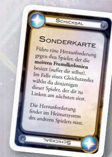
Beispiel einer Sonderkarte