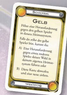
Beispiel einer Farbkarte

Hinweis: Manche Farbkarten zeigen eine Gefahrenwarnung. Diese hat für das Spiel derzeit noch keine Relevanz und erhält erst in einer späteren Erweiterung eine Bedeutung.