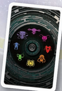
Rückseite der Schicksalskarten

Dann zieht der Angreifer die oberste Karte des Schicksalsstapels. Dieser Kartenstapel enthält Farbkarten, Sonderkarten und Joker. Besteht der Stapel aus nur noch einer Karte, wird diese nicht gezogen; stattdessen wird diese letzte Karte mit den abgelegten Schicksalskarten gemischt. Von diesem neuen Schicksalsstapel zieht der Angreifer dann die oberste Karte.