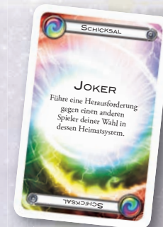
Beispiel für einen Joker

Falls die gezogene Karte eine Sonderkarte ist, bestimmt sie die Bedingungen für die Herausforderung. Die Sonderkarte bestimmt sowohl den Verteidiger für diese Herausforderung als auch den Ort der Herausforderung. Für Spielereffekte (wie z. B. die Sonderfähigkeit Exekution der Schatten) werden Sonderkarten so behandelt, als würden sie die Farbe des durch sie bestimmten Verteidigers zeigen.