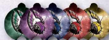
Koloniemarker der Spieler

Diese Marker werden auf die Zählleiste am Rand des Warp gelegt, um die zum Sieg benötigten Kolonien der Spieler zu zählen.