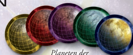
Planeten der Spieler

Jeder Spieler erhält 5 Planeten in seiner Spielerfarbe. Diese 5 Planeten bilden das Heimatsystem des Spielers.