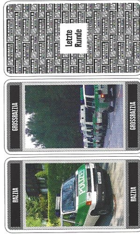
Razziakarte und Großrazziakarte (Vor- und Rückseite)

Mit der drohenden Großrazzia der Polizei wird die letzte Runde des Spiels eingeleitet. Wird diese Karte aufgedeckt, kommt danach jeder Spieler noch genau einmal an die Reihe, bevor die Endwertung erfolgt.