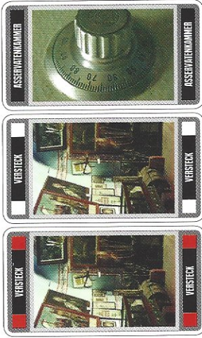
Versteckkarten (Beispiele) und Asservatenkammerkarte

In die Asservatenkammer der Polizei kommen alle Gemälde, die bei einer Razzia nicht in ein anderes Versteck gebracht werden konnten. Ihre Kapazität ist unbegrenzt.