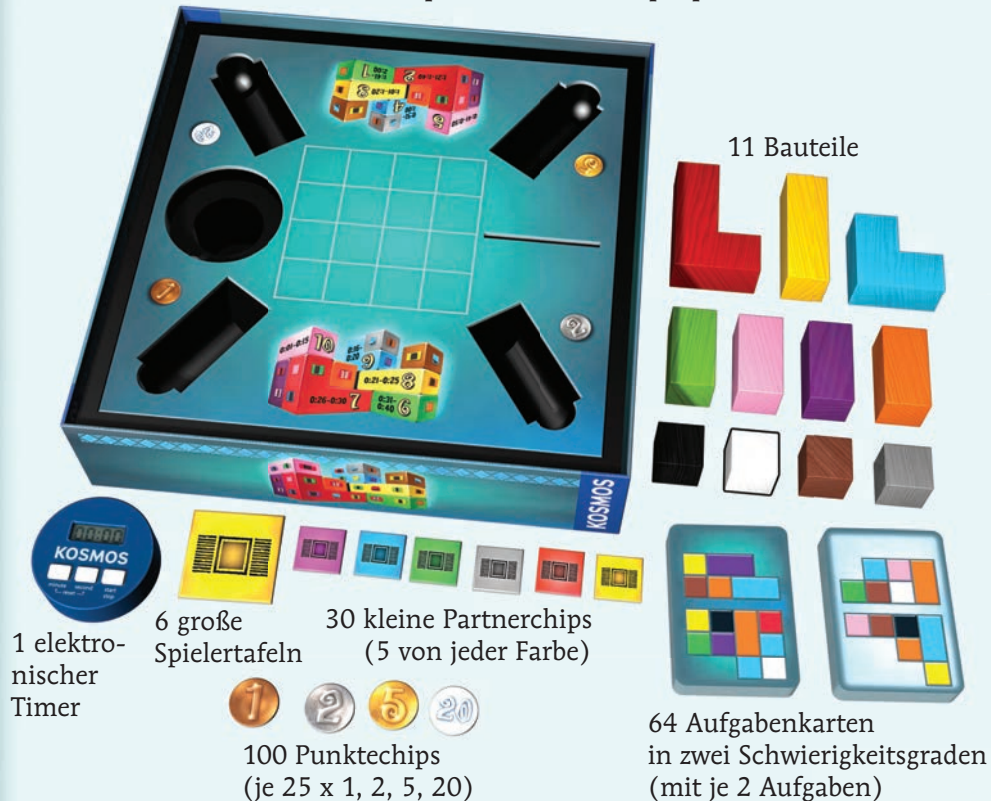
Spielschachtel mit Spielplan