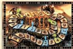
1 doppelseitiger Spielplan