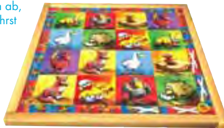
Abb. 4c Die Randplättchen mit den weißen Kreuzen gelten für den gelben Spieler nicht.

Die Randplättchen bleiben immer im Rahmen liegen!